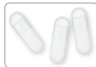
※「カプセル」タイプに使用

植物由来の原料で酸性溶液 ( pH1.2 ) で溶けにくいとため、酸に弱い素材に適している、乾燥条件下でも非常に割れにくいカプセルです。